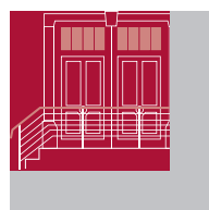
SMALTI E PRODOTTI TRASPARENTI