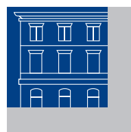
PRODOTTI PER ESTERNI